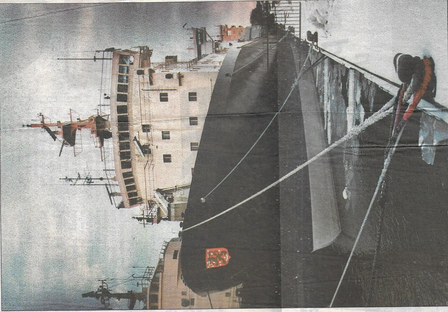
Jäänmurtaja Voima odotti keskiviikkona Katajanokalla työtehtäviä.

Jäänmurtajien miehitystä on tarkasteltu aiemminkin, ja on todettu, että miehistöt ovat tarpeettoman suuria, kesäistä luppoaikaa on paljon ja alalle