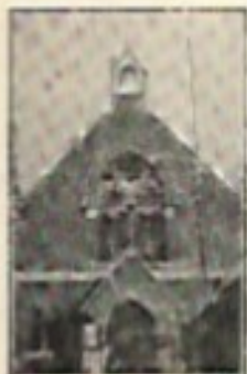
Santa Sverre Kyrkan (Scandinavian Church) Grimsby

SKANDINAVISKA SJÖMANSKYRKANS LÄSRUM (SWEDISH MISSION) IMMINGHAM DOCK Linn, England